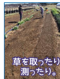
草を取ったり測ったり。