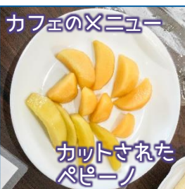
カフェのメニュー