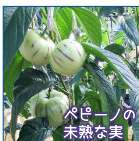
ペピーノの未熟な実