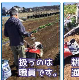
扱うのは職員です。