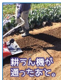
耕うん機が通ったあと。