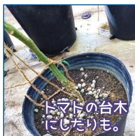
トマトの台木にしたりも。

食べ方は、単にカットして食べるのが一般的ですが、パイに使っても、ジャムを作っても美味しいです。