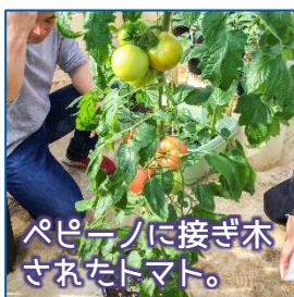
ペピーノに接ぎ木されたトマト。

また、トマトとの接ぎ木の相性がよく、台木にすると病気に強いトマトが育つとのことでした。