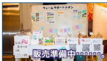
にぎわいイベント。