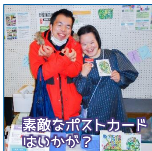
素敵なポストカードはいかが？