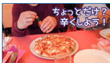
ちょっとだけ？ 辛くしよう！