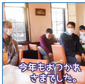
今年もおつかれさまでした。