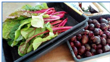
左がスイスチャード、右はサラダビーツです。

スイスチャードやコールラビ、サラダビーツやラディッシュといった、ちょっとだけ珍しい野菜が収穫できました。これも、いつもどおり販売会で売ってみたいと思っています。