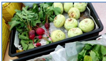
左がラディッシュ、右はコールラビです。

スイスチャードやコールラビ、サラダビーツやラディッシュといった、ちょっとだけ珍しい野菜が収穫できました。これも、いつもどおり販売会で売ってみたいと思っています。