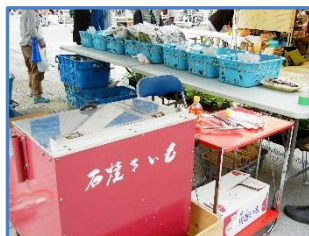
みんなで販売の準備中

「福祉の市」は11月4日におこなわれました。この日の目玉商品は小松菜と、シオン農園で収穫したチンゲン菜で、どちらも完売することができました。