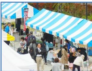
賑わうシオンのブース